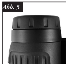
Abb. 5 Augenmuschel in Stellung "unten"