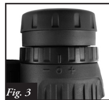
Fig. 3 Anillo de ajuste de dioptrías bloqueado