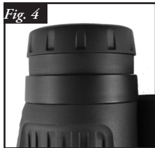
Eyecup in “Up” Position

Your Bushnell Legend Ultra HD binocular is fitted with twist-up eyecups designed for your comfort and to exclude extraneous light. For users without eyeglasses, twist the eyecups up, rotating the eyecups counter-clockwise until they lock into the fully “up” position ( Fig. 4 ). If you wear glasses, make sure the eyecups are in the down position- this will bring your eyes closer to the binocular lens, allowing you to see the full field of view. To lower the eyecups from the full “up” position, rotate them clockwise ( Fig. 5 ). The eyecups may also be left at positions “in between” fully up and fully down, which may suit some individuals better.