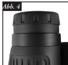
Abb. 4 Augenmuschel in Stellung "oben"

Ihr Bushnell LegendUltra HD-Fernglas ist mit hochdrehbaren Augenmuscheln ausgestattet, um den Anwendungskomfort zu erhöhen und das Eindringen von Außenlicht zu verhindern. Wenn Sie kein Brillenträger sind, drehen Sie die Augenmuscheln gegen den Uhrzeigersinn nach oben, bis sie in der obersten Stellung einrasten ( Abb. 4 ). Wenn Sie Brillenträger sind, sollten Sie die Augenmuscheln in die untere Stellung bringen. Dadurch befinden sich Ihre Augen näher an der Fernglaslinse und Sie können das gesamte Sehfeld überblicken. Zum Herunterdrehen aus der hochgedrehten Position drehen Sie die Augenmuscheln einfach im Uhrzeigersinn ( Abb. 5 ). Es ist auch möglich, die Augenmuscheln an einer Stelle zwischen der obersten und untersten Stellung zu belassen, was für manche Benutzer möglicherweise die beste Lösung ist.