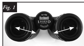
Ajuste de la distancia interpupilar