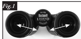
Regolazione della distanza interpupillare

Reimpostare sempre il binocolo in questa posizione prima di usarlo.