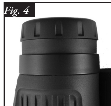
Conchiglia oculare in posizione "Su"

Il binocolo Bushnell LegendUltra HD è provvisto di conchiglie oculari pieghevoli progettate per maggiore comodità di osservazione e per escludere la luce esterna. Per coloro che non indossano occhiali, piegare le conchiglie oculari verso l'alto ruotandole in senso antiorario finché non sono completamente bloccate nella posizione "su" (Fig. 4). Se si indossano occhiali, assicurarsi che le conchiglie oculari siano in posizione "giù"; ciò consentirà di avere gli occhi più vicini alle lenti del binocolo permettendo così di osservare l'intero campo visivo. Per abbassare le conchiglie oculari dalla posizione estrema "su" ruotarle semplicemente in senso orario (Fig. 5). Le conchiglie oculari possono essere lasciate in posizione "in mezzo" tra le posizioni estreme superiore e inferiore rendendole più adatte per determinate persone.