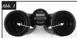
Anpassen an den Augenabstand