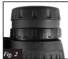
Fig. 2 Anillo de ajuste de dioptrías desbloqueado