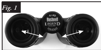
Interpupillary Distance Adjustment