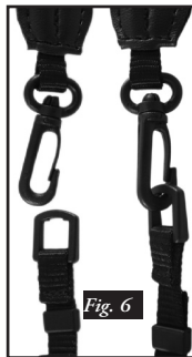
Cinta de cuello