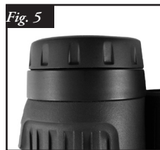
Conchiglia oculare in posizione "Giù"