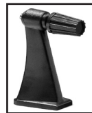
Adaptador de trípode para gemelos (opcional) (Bushnell n.º 161001CM)