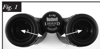
Réglage de l'écart inter pupillaire